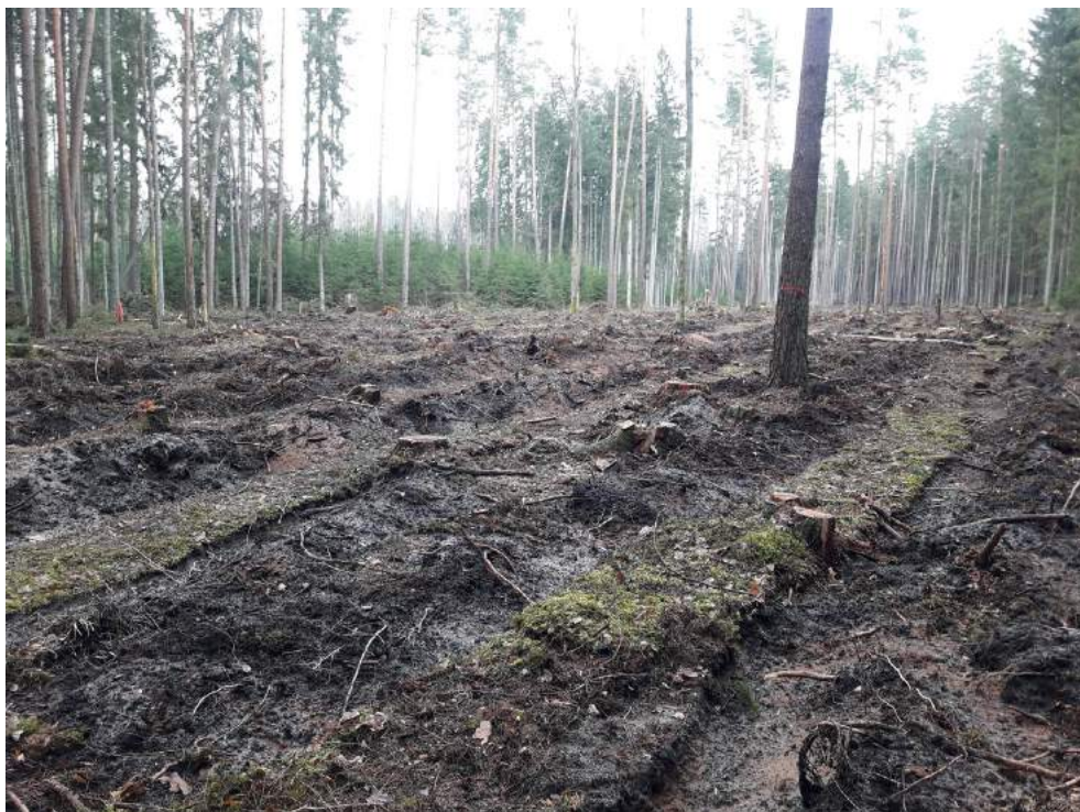
Paveikslas 4 Plyni kirtimai Punios šile