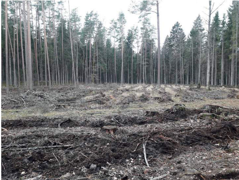
Paveikslas 3 Plyni kirtimai Punios šile