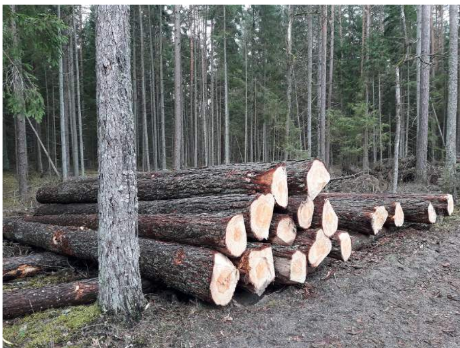
Paveikslas 1 Plynį kirtimai Punios šile. Rietuvėse - sveikos pušys

Rietuvėse matomos nupjautos sveikos pušys.