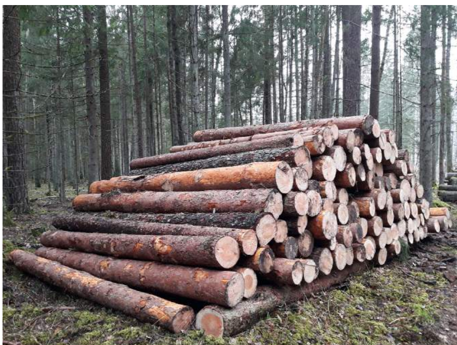
Paveikslas 2 Plynį kirtimai Punios šile. Rietuvėse - sveikos pušys